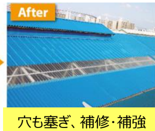
穴も塞ぎ、補修・補強